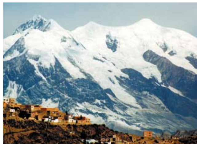
Periferien af La Paz city i Bolivia, Sydamerika.

ved ankomst til havniveau havde unaturligt høje mfERG amplituder, som fortsatte med at vokse gennem 10 ugers observation ved havniveau. De hæmatologiske værdier normaliseredes under observationsperioden. Langtidsadaptationen i højlandets nethinde afvikles ikke i takt med den hæmatologiske akklimatisering, men består i mindst 2½ måned og med tiltagende abnormitet, om end med aftagende vækstrate. Mekanismen bag denne neuronale adaptation er ukendt, og fænomenet er ikke tidligere beskrevet. Tidskonstanten for denne adaptationsproces minder om den, der gælder for nethindens tilvæning til et reduceret glukoseniveau: I tidligere studier var intensiveret insulinbehandling forbundet med forbigående accelereret retinopatiprogression. Pågående kliniske studier sigter mod at opklare, hvilke fysiologiske fænomener og tidskonstanter, der er involveret i den retinale adaptation til ændret glykæmi ved diabetes mellitus, ændret iltension ved lungekredsløbssygdom og fysisk træning, samt ændret perfusion ved carotisstenose og operation for samme. ■